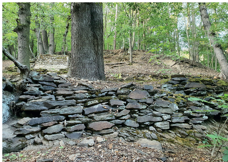
Zídka na jižním svahu, bývalých vinohrad

Dnes je toto prostranství zarostlé nálety, vysokou trávou a hustými křovinami. Vydejme se zpět do civilizace. Za Zaječákem se napojíme na zeleně vyznačenou naučnou stezku s názvem „Po stopách horníků“. Stezka kopíruje tzv. Střeleckou stezku a zavede nás okolo středověké dřevěné zvonice do Husitské ulice. Ulicí dolů okolo muzea, kostela Nanebevzetí Panny Marie, Hasičského muzea a Špitálního kostela Sv. Ducha, se napojíme na Cínovou ulici. Projdeme Libušínem, okolo Kostela sv. Anny a u Kozí dráhy se napojíme na pěšinu vedoucí podél trati zpět na místo, odkud jsme vycházeli. Cesta má cca 3,5 km, není vhodná pro kočárky a zdoľáte jí přibližně za 1 hodinu a 15 min.